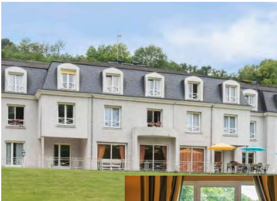
Vue extérieure et vue intérieure de la résidence à St Pierre les Nemours (Korian Chaintréauville)

- Avertissements : ne préjuge pas des acquisitions futures de la SCPI ni de la performance annuelle ou future de la SCPI. Le rendement AEM ne constitue pas un objectif de performance et ne préjuge pas du taux de distribution futur de la SCPI -